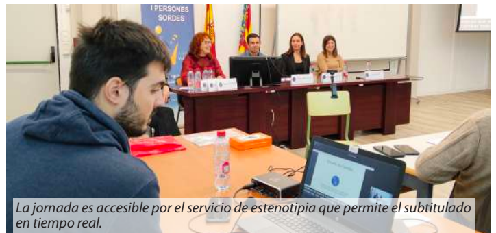
La jornada es accesible por el servicio de estenotipia que permite el subtítulo en tiempo real.